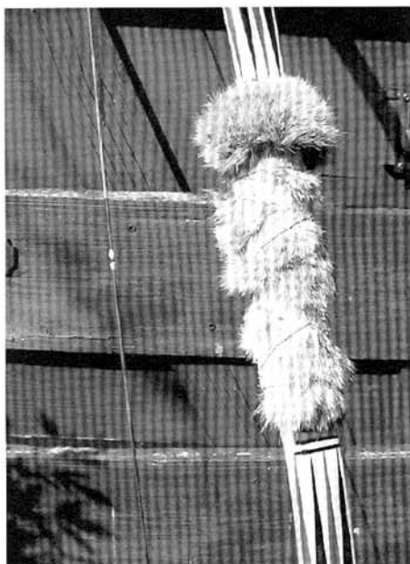
Riser met konijnenbont afgewerkt

in. Schaven en vijlen. Toen de vorm er was moest de boog op de tillerbalk en met een tijdelijke pees kon de boog gespannen worden. Het leek toch echt wel op een boog... Met een unster kon ik het trekgewicht meten: ongeveer 50 pond haalde ik er uit. Leek mij wel aardig en kon nog iets minder, maar dat zou bij het afwerken vanzelf gebeuren. Dat afwerken doe je met een