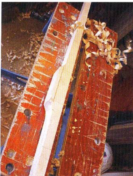
Flatbow na meten, zagen en schaven...

Nee, zo'n vizier op je boog staat misschien wel leuk, maar het is geen garantie om altijd maar in het geel te schieten. Mij leverde dat steeds meer stress op. Een boog met alles er op en er aan en dan een resultaat dat niet naar wens is!