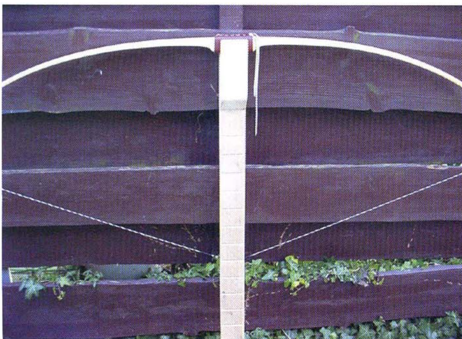
De boog op de tillerbalk

Natuurlijk weet ik ook wel dat het niet de boog is die het resultaat bepaalt, maar de schutter. En natuurlijk weet ik ook wel dat veel van het falen zowel een fysiek, technisch, als een mentaal aspect is. Maar