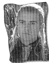
[tekst: Hans Veldhuis]

Voor de filmproductie van regisseur Peter Jackson moest Bloom onder andere het boogschieten onder de knie krijgen. Hiervoor heeft hij dan ook goed moeten trainen. In de film is het meer de schiettechniek die belangrijk is, het resultaat wordt vaak bepaald door het gebruik van de computer. Dit maakt het totale resultaat er niet minder om. Het blijft fantastisch om te zien hoe Legolas zijn doel raakt.