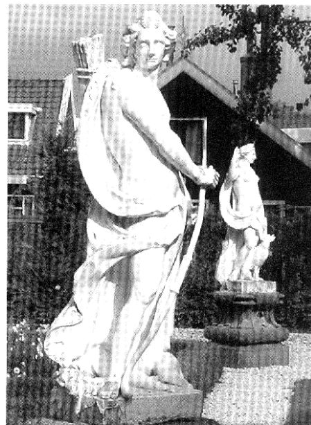
Hier staat even verder Morgen.

dijk. Daar staat 'Het Weefhuis', het kantoor van Vereniging de Zaanse Molen. Voor dit kantoor in de Beeldentuin staan vijf beelden voorstellende Bacchus, Avond, Nacht, Morgen en Middag.