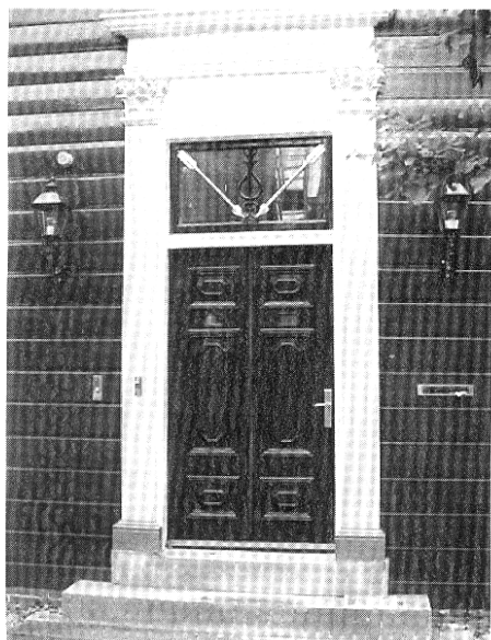
Door zijn breedte suggereert deze deur een dubbele deur te zijn. De Corinthische pilasters aan weerszijden van de deur versterken het imposante geheel.

Als koopmanshuis gebouwd in 1851, in 1873 notaris woning, van 1916 tot 1969 burgemeesters woning en daarna een bedrijfshoofdkantoor. Tussentijds heeft het pand verschillende verbouwingen ondergaan. Nu is het pand weer zoveel als mogelijk teruggebracht in de originele staat. sinds 1968 is het pand rijksmonument be-