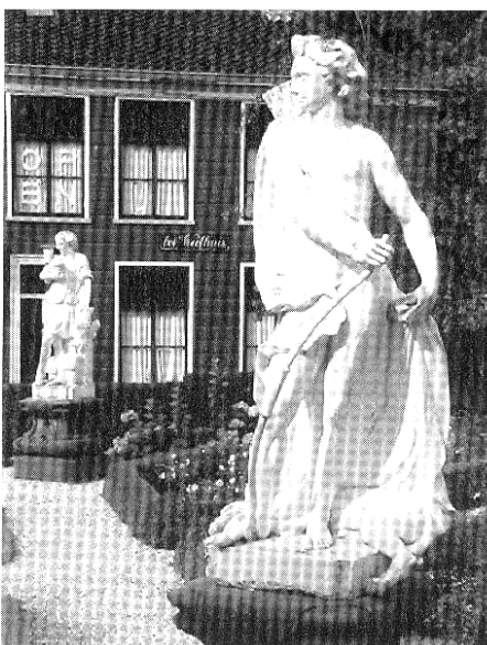
Op de achtergrond voor Het Weefhuis staat Avond.

Ook een plek waar ik toch regelmatig fietsend langs kom, is de Beeldentuin in Zaan-