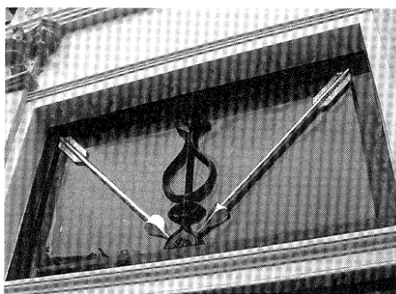
Mooie gouden pijlen in het bovenlicht.