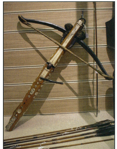
Fraai bewerkte kruisboog