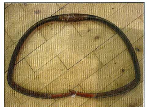
Ontspannen Turkse boog