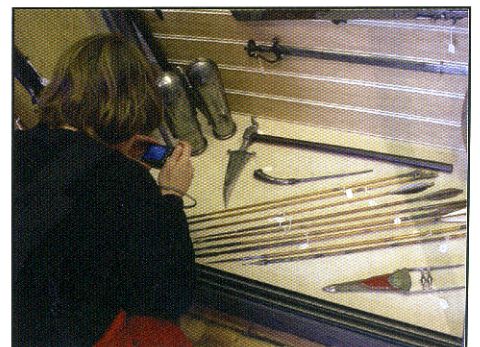
Voor het maken van foto's kregen we alle ruimte