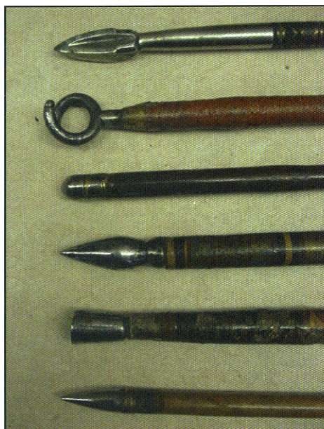
Verschillende soorten pijlpunten

In een tearoom thee met scones genuttigd. Lekker Engels. Verder slenterend door Stratford komen we in Sheep Street. Daar zien we een wapenschild aan de wand hangen met daarop de tekst: Antique Arms and Armour. Dit trok onze aandacht en na enig zoeken kwamen we via een steegje bij een grote zwarte deur. Ja, de deur was open en even later stonden we in een prachtige ruimte vol met antiek wapentuig. We werden welkom geheten door Geoff Colwell die net bezig was met de restauratie van een kruisboog. De man leidde ons langs de vitrines die gevuld waren met oude geweren, lansen, Turkse bogen en een verscheidenheid aan laat-middeleeuwse pijlen. Mogelijk uit het Verre Oosten. We waren enthousiast geworden door het zien van deze prachtige en soms vreemd uitzijnde pijlen. Op de vraag of we foto's mochten maken werd direct gereageerd door de vitrines open te maken. Geoff bleef trots vertellen over zijn antieke wapentuig. We zijn zo'n klein uurtje gebleven voor we onze wandeling door Stratford weer voortzetten.